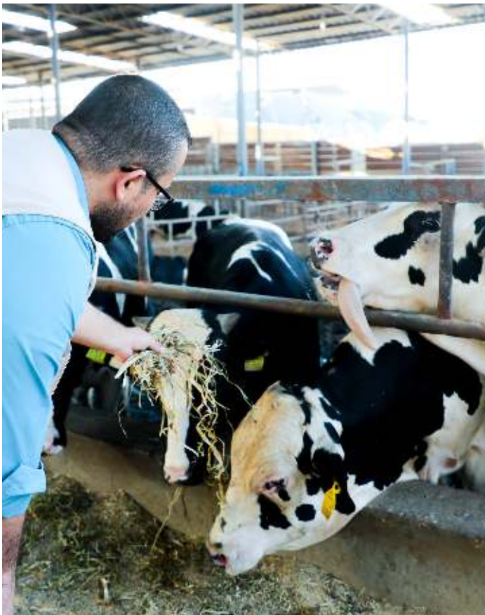
Vos dons du Qurbani en action

Nous veillons à ce que les familles les plus vulnérables reçoivent la meilleure qualité de viande fraîche en l'espace de trois jours. Nous travaillons avec des bouchers expérimentés et des leaders religieux dans chaque communauté durant l'entièreté du processus afin d'assurer que le sacrifice de l'animal soit éthique et conforme à la tradition islamique.