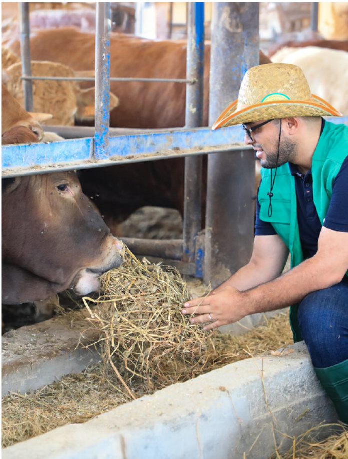
Vos dons du Qurbani en action

Nous veillons à ce que les familles les plus vulnérables reçoivent la meilleure qualité de viande fraîche en l'espace de trois jours. Nous travaillons avec des bouchers expérimentés et des leaders religieux dans chaque communauté durant l'entièreté du processus afin d'assurer que le sacrifice de l'animal soit éthique et conforme à la tradition islamique.